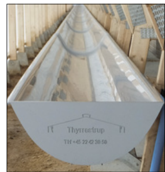
Thyrrerstrup Mink's gyllerende er Danmarks bredeste på 41 cm. Den er svejset i samlingerne så der ikke er ujævnheder, når skraberen kører igennem renden.

- Minkbranchen er jo kendt for at dækningsbidraget svinger noget, men si-